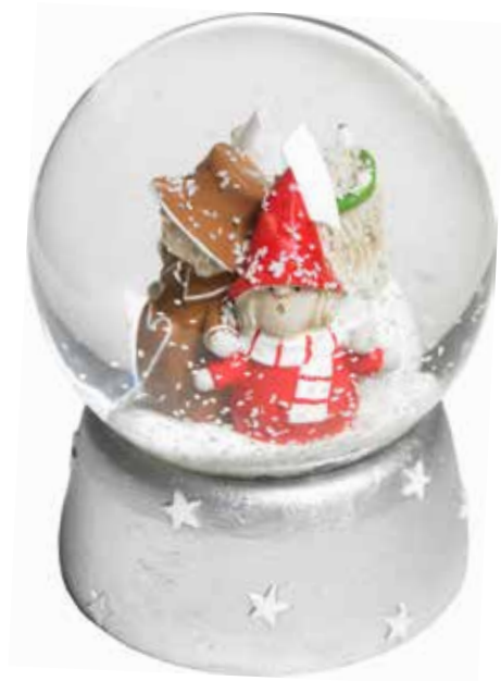
7126 Snökula Lussetåg H.8cm Snow ball Lucia figures H.8cm Design Ruth Vetter