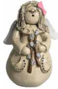
5360-3 Ängel Mars H.7cm Angel March H.7cm