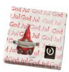
722090 Servetter Tomten Tage "God Jul" 33x33cm Paper napkins Santa Tage "God Jul" 33x33cm Design Ruth Vetter