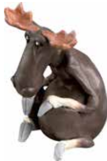
6934 Älg sitter stor H.20cm Elk sitting large H.20cm