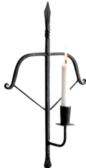
2363 Ljusstake vägg Armborst H.43cm Candlestick Crossbow for wall wrought iron H.43cm