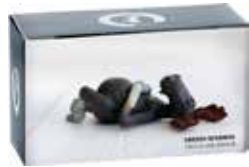
6916-2 Älg vilande i presentask L.11cm Elk resting in Gift box L.11cm