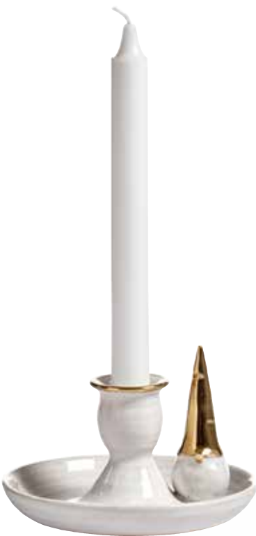
8991 Ljusstake Tomte Guld H.8,5cm Candle holder Santa Gold H.8,5cm