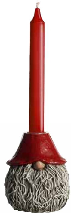
7902 Ljusstake Herman H.11cm Candle holder Herman H.11cm