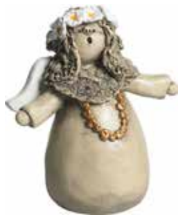
5360-6 Ängel Juni H.7cm Angel June H.7cm