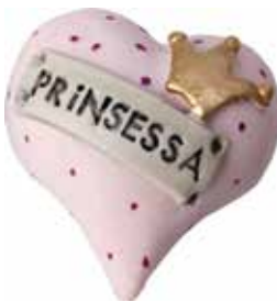
5622 Hjärta "Prinsessa" L.5cm Heart "Prinsessa" L.5cm