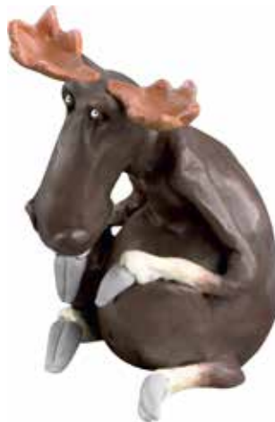
6934100 Älg sitter stor H.100cm Elk sitting large H.100cm