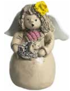
5360-4 Ängel April H.7cm Angel April H.7cm