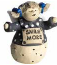
5370-2 Ängel "Smile more" H.7cm Angel "Smile more" H.7cm