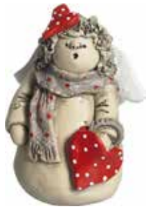
5360-2 Ängel Februari H.7cm Angel February H.7cm