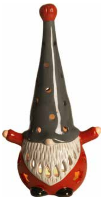
7791 Lykta Tomten Hugo röd H.24cm Lantern Santa Hugo red H.24cm