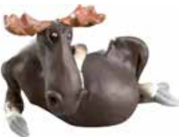
6932 Älg liggande L.20cm Elk lying down L.20cm