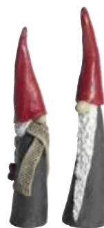
77322 Tomten den långa & Mor H.13,5-14,5cm Tall Santa and Mother H.13,5-14,5cm