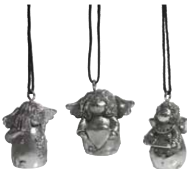
5380 Hängande Silverränglar 3st H.3,5cm Hanging Silver angels 3pcs H.3,5cm