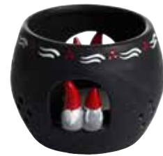
8856-7 Ljuslykta Thor & Thora ø7,5cm Candle holder Thor & Thora ø7,5cm