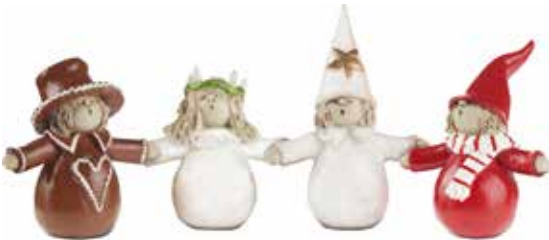
7125-4 Lussetåg 4 figurer H.6-9cm Lucia figures 4 assorted H.6-9cm 7125-4S Lussetåg litet 4 figurer H.4-5cm Lucia figures small 4 assorted H.4-5cm Design Ruth Vetter