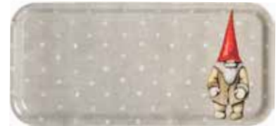
76003215 Bricka Tomten Bengt 32x15cm Tray Santa Bengt 32x15cm