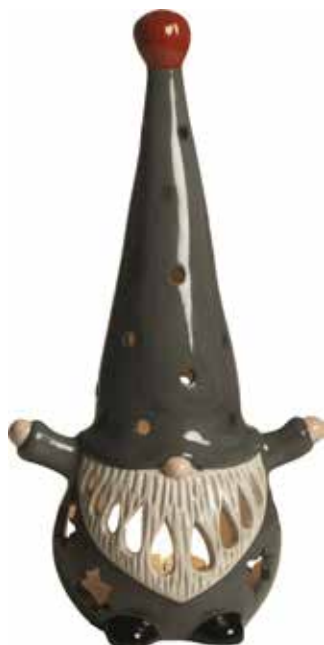
7781 Lykta Tomten Hugo grå H.28cm Lantern Santa Hugo grey H.28cm