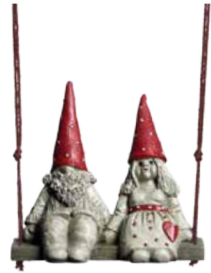
7613 Gunga Tomten Bengt & Nanna H.7cm Swing Santa Bengt & Nanna H.7cm