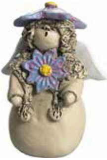
5360-5 Ängel Maj H.7cm Angel May H.7cm