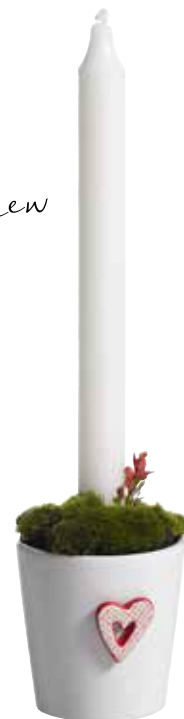
10508 Ljusstake Marie ø7,5cm Candle holder Marie ø7,5cm