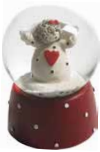
5372 Snöglob Ängel H.6cm Gobe Angel H.6cm