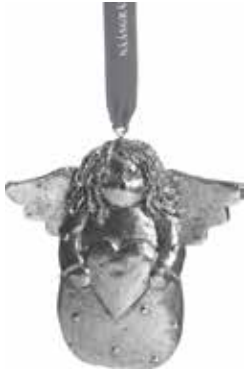
5371-1 Ängel dekoration silver H.7cm Angel decoration silver H.7cm