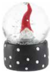
7050-W1 Snökula Dekortomte 1 tomte H.6cm Snow ball Santa High Hat 1 santa H.6cm