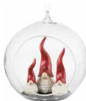
7051-G3 Glaskula Dekortomte 3 tomtar H.12cm Glass ball Santa High Hat 3 santa H.12cm