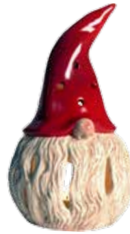
7901 Lykta Tomten Herman H.20cm Lantern Santa Herman H.20cm

Herman is a sneaky santa and has the ability to pop up in the most unexpected places.