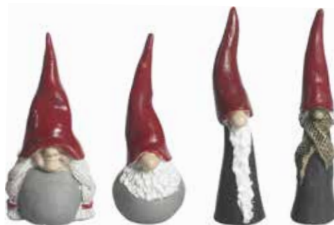
6001 Familjen Andersson set H.6-7cm Familjy Andersson set H.6-7cm