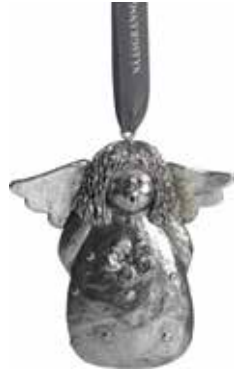
5371-2 Ängel dekoration silver H.7cm Angel decoration silver H.7cm