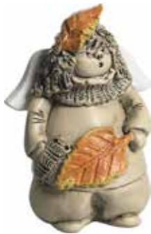
5360-10 Ängel Oktober H.7cm Angel October H.7cm