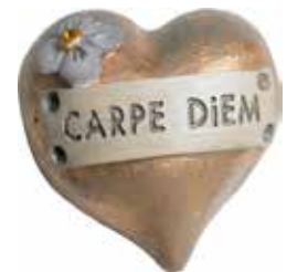
5638 Hjärta "Carpe diem" L.5cm Heart "Carpe diem" L.5cm