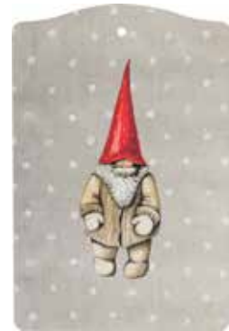
76003020 Skärbräda Tomten Bengt 30x20cm Cutting board Santa Bengt 30x20cm