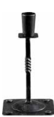
2359 Ljusstake Smide låg H.20cm Candle stick Wrought iron low H.20cm