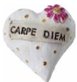
5630 Hjärta "Carpe diem" L.5cm Heart "Carpe Diem" L.5cm