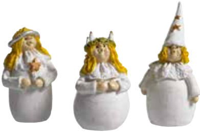
7145 Lucia & Co H.4-5cm Lucia & Co H.4-5cm Design Ruth Vetter