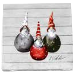
34109 Servetter Tomtarna Hans Roland Åke 25x25cm Papernapkins Santas Hans Roland Åke 25x25cm