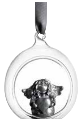
5385-1 Glaskula Silverängel ø6cm Glasball Silver angel ø6cm