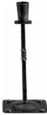
2360 Ljusstake Smide hög H.24cm Candle stick Wrought iron high H.24cm