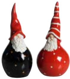
7502 Salt & Peppar Hans Åke H.11,5cm Salt & Pepper Hans Åke H. 11,5cm