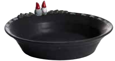
8855-23 Skål Thor & Thora ø23cm Bowl Thor & Thora ø23cm