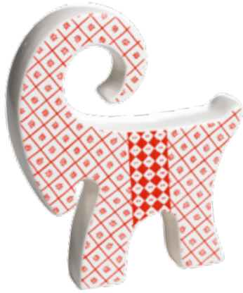
10502 Bruse H.13cm Bruse H.13cm