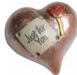
5637 Hjärta "Just for you" L.5cm Heart "Just for you" L.5cm