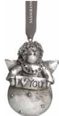
5371-4 Ängel dekoration silver H.7cm Angel decoration silver H.7cm