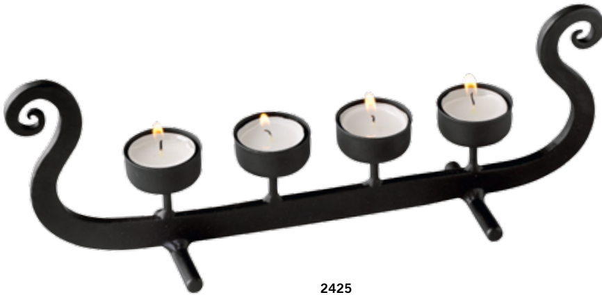
2425 Vikingskepp 4 värmeljus svart L.34cm Viking ship 4 candleholders black L.34cm