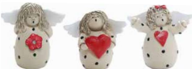
5393 Ängel Tre små med hjärta H.4cm Angel Three small with heart H.4cm