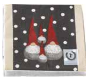
35100 Servetter Dekortomte 33x33cm Paper napkins Santa High 33x33cm Design Ruth Vetter