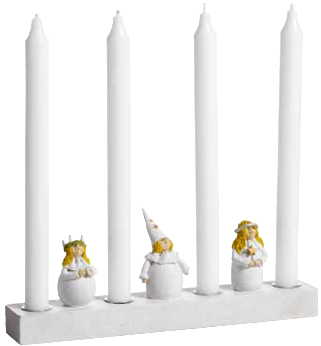
7140 Ljusstake Lucia & Co H.11,5cm Candle holder Lucia & Co H.11,5cm Design Ruth Vetter