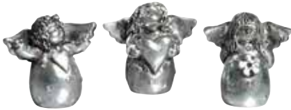
5378 Tre silverränglar med hjärtan H.4cm Three silver angels with heart H.4cm