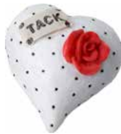
5626 Hjärta "Tack" vit L.5cm "Heart "Tack" white L.5cm