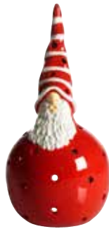
7501 Lykta Hans H.18cm Lantern Hans H.18cm