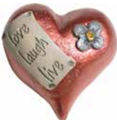
5635 Hjärta "Love, laugh, live" L.5cm Heart "Love, laugh, live" L.5cm