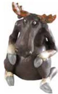
6924 Älg sitter liten H.14cm Elk sitting small H.14cm