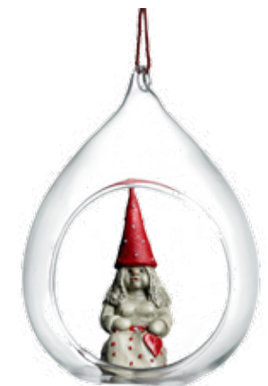
7611 Glaskula Tomtemor Nanna H.10,5cm Glass ball Santa Mother Nanna H.10,5cm

Namnet tomte är egentligen en förkortning av äldre benämningar som tomtkarl, tomtgubbe och tomtnisse. Det har sitt ursprung i ordet tomt och syftar på gården och dess ägor. Tron på tomten är väldigt gammal och fanns troligen redan under förkristen tid.