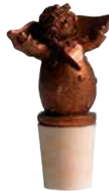
5386-2 Vinkork Ängel koppar H.7cm Bottle stopper Angel copper H.7cm