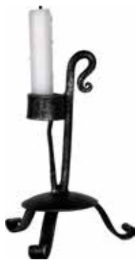
2368 Ljusstake smide antik H.20cm Candlestick wrought iron antique H.20cm