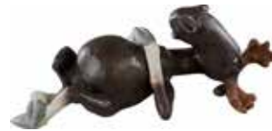
6923 Älg vilande liten L.20cm Elk resting L.20cm