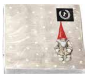
34104 Servetter Tomte Bengt 25x25cm Paper napkins Santa Bengt 25x25cm