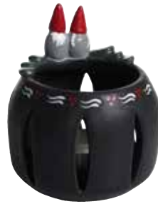
8856-6 Ljuslykta Thor & Thora ø6,5cm Candle holder Thor & Thora ø6,5cm