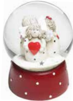
5373 Snöglob Änglar H.8cm Globe Angels H.8cm