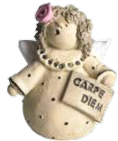
5370-4 Ängel "Carpe diem" H.7cm Angel "Carpe diem" H.7cm