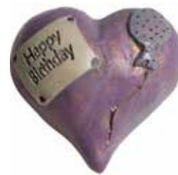
5641 Hjärta "Happy birthday" L.5cm Heart "Happy birthday" L.5cm