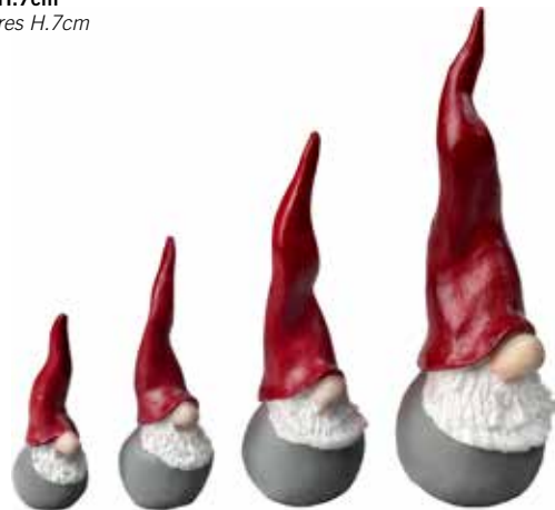
7055-50 Dekortomte 4 sorterade H.4,5-10cm Santa High Hat 4 assorted H.4,5-10cm