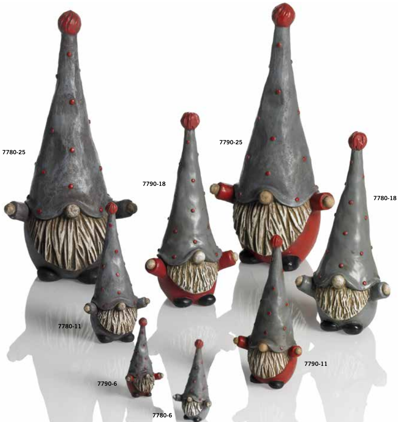
7780-6 Tomten Hugo grå H.6,5cm Santa Hugo grey H.6,5cm 7780-11 Tomten Hugo grå H.11,5cm Santa Hugo grey H.11,5cm 7780-18 Tomten Hugo grå H.18cm Santa Hugo grey H.18cm 7780-25 Tomten Hugo grå H.25cm Santa Hugo grey H.25cm 7790-6 Tomten Hugo röd H.6,5cm Santa Hugo red H.6,5cm 7790-11 Tomten Hugo röd H.11,5cm Santa Hugo red H.11,5cm 7790-18 Tomten Hugo röd H.18cm Santa Hugo red H.18cm 7790-25 Tomten Hugo röd H.25cm Santa Hugo red H.25cm