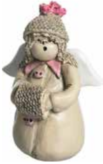
5360-1 Ängel Januari H.7cm Angel January H.7cm