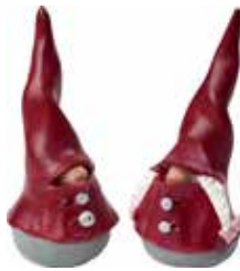
7055-K Dekortomte barn sorterade H.5,5cm Santa High Hat Kids assorted H.5,5cm