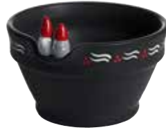
8855-11 Skål Thor & Thora ø11,5cm Bowl Thor & Thora ø11,5cm