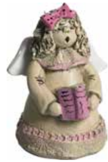
5360-8 Ängel Augusti H.7cm Angel August H.7cm