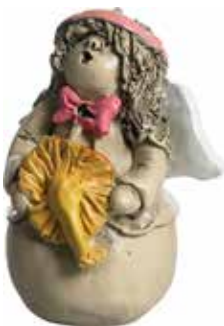
5360-9 Ängel September H.7cm Angel September H.7cm