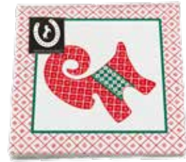
34110 Servetter Marie 25x25cm Paper napkins Marie 25x25cm