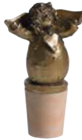
5386-1 Vinkork Ängel guld H.7cm Bottle stopper Angel gold H.7cm