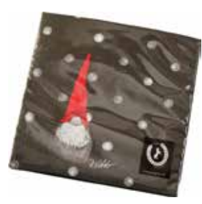
35101 Servetter Dekortomte 1 tomte 33x33cm Paper napkins Santa High hat 1 santa 33x33cm Design Ruth Vetter