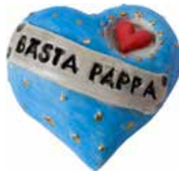
5621 Hjärta "Bästa pappa" L.5cm Heart "Bästa Pappa" L.5cm