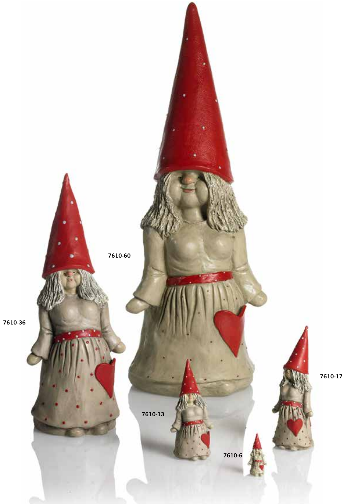
7610-6 Tomtemor Nanna H.6cm Santa Mother Nanna H.6cm 7610-13 Tomtemor Nanna H.13cm Santa Mother Nanna H.13cm 7610-17 Tomtemor Nanna H.17cm Santa Mother Nanna H.17cm 7610-36 Tomtemor Nanna H.36cm Santa Mother Nanna H.36cm 7610-60 Tomtemor Nanna H.60cm Santa Mother Nanna H.60cm