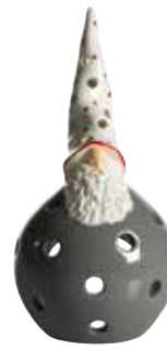
7511 Lykta Roland H.18cm Lantern Roland H.18cm