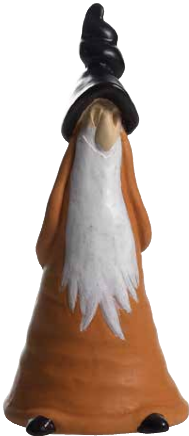
8930-1 Ljussläckare Svante brun H.11cm Snuffer Svante brown H.11cm