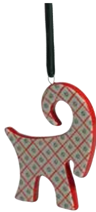
10503 Dekoration Bruse 4st H.8cm Decoration Bruse 4pcs H.8cm