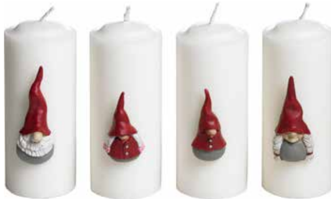
7055-5 Ljussticks Dekortomte familjen 4 figurer H.7cm Candle decor Santa High Hat family 4 figures H.7cm