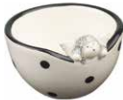
5310 Ljuslykta/skål Tittut Ängeln ø7cm Candle holder/bowl Peek-a-boo Angel ø7cm