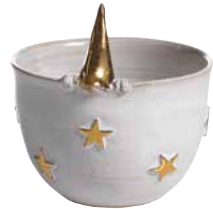
8990-10 Skål Tomte Guld ø11cm Bowl Santa Gold ø11cm