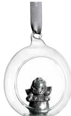
5385-4 Glaskula Silverängel ø6cm Glasball Silver angel ø6cm