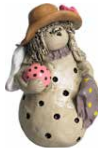
5360-7 Ängel Juli H.7cm Angel July H.7cm