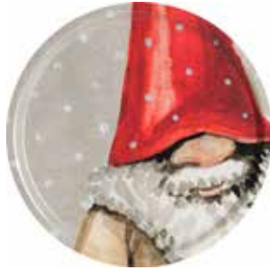
760038 Bricka Tomten Bengt ø38cm Tray Santa Bengt ø38cm