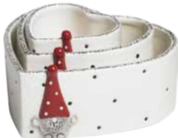
7783-7 Skål hjärta Tomten Hugo ø7cm Bowl heart Santa Hugo ø7cm