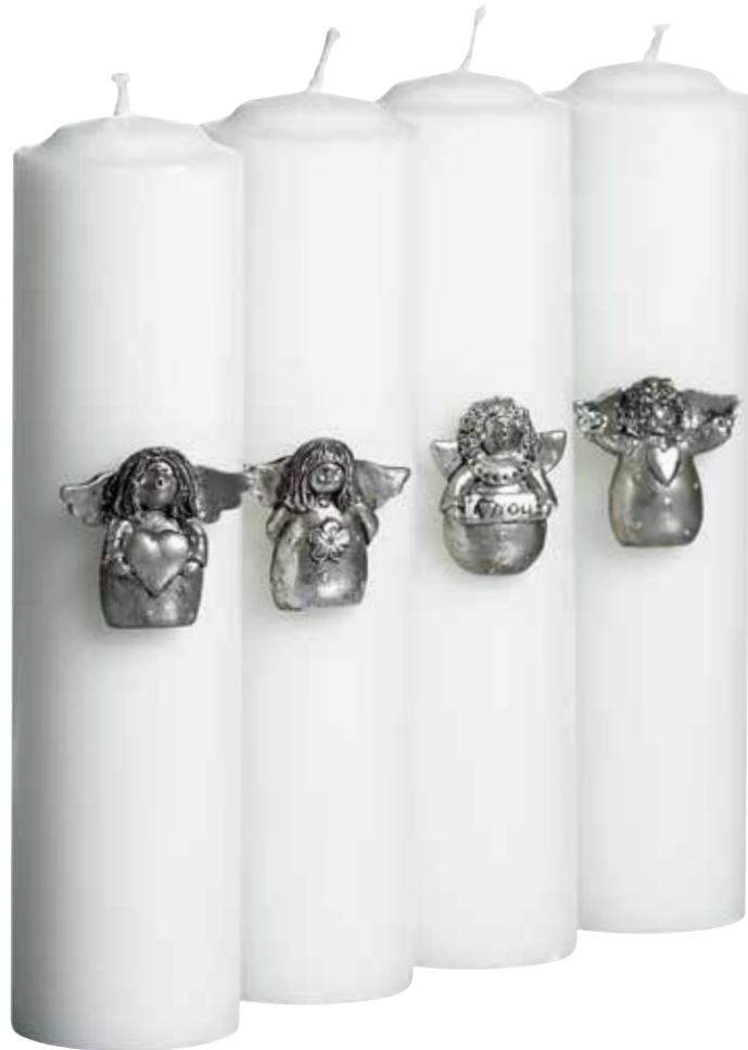
5379 Ljussticks Silverränglar 4 figurer H.4-5cm Candle decor Silver angels 4 figures H.4-5cm