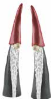
7732 Tomten den långa 2st H.15cm Tall Santa 2pcs H.15cm