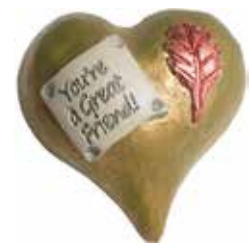
5636 Hjärta "You're a great friend" L.5cm Heart "You're a great friend" L.5cm