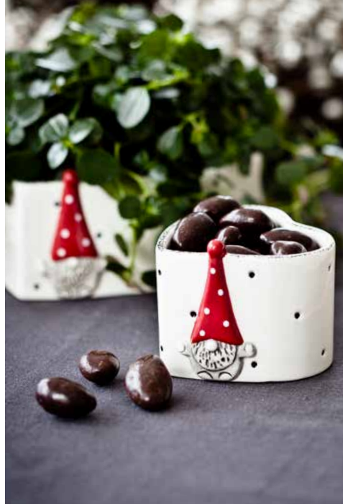
7783-12 Skål hjärta Tomten Hugo ø12cm Bowl heart Santa Hugo ø12cm