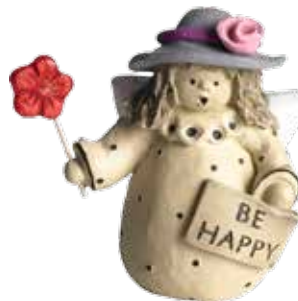
5370-5 Ängel "Be happy" H.7cm Angel "Be happy" H.7cm