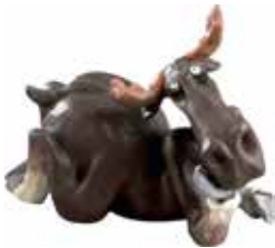
6920 Älg kokett L.12cm Elk coquettish L.12cm