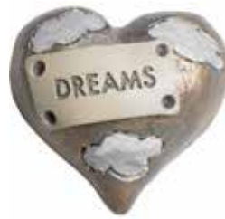
5640 Hjärta "Dreams" L.5cm Heart "Dreams" L.5cm