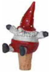
7225 Vinkork Tomten Tage H.10cm Bottle stopper Santa Tage H.10cm