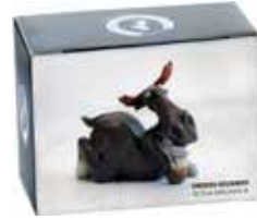
6918-2 Älg kokett i presentask L.9cm Elk coquettish in Gift box L.9cm