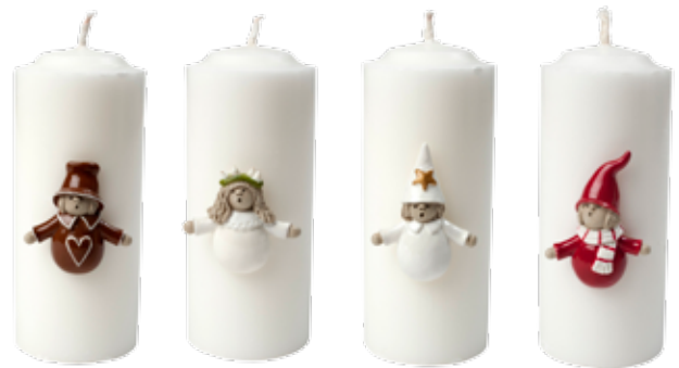
7125-ST Ljussticks Lussetåg H.4-5cm Candle decor Lucia figures H.4-5cm Design Ruth Vetter