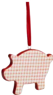
10504 Dekoration Malte 4st H.6cm Decoration Malte 4pcs H.6cm