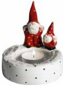
7250-1 Ljusstake Tomtarna Elmer & Max H.11cm Candle holder Santas Elmer & Max H.11cm