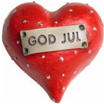
5634 Hjärta "God Jul" L.5cm Heart "God Jul" L.5cm