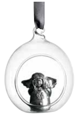
5385-3 Glaskula Silverängel ø6cm Glasball Silver angel ø6cm