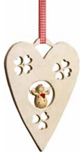
5376-1 Hängande hjärta Ängel H.20cm Hanging heart Angel H.20cm