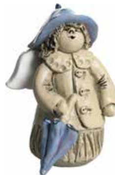
5360-11 Ängel November H.7cm Angel November H.7cm