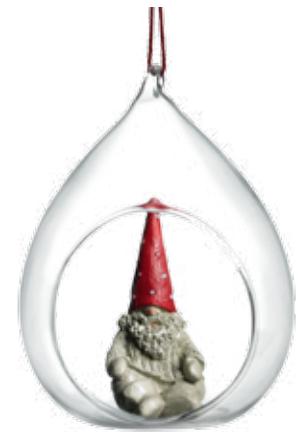
7612 Glaskula Tomten Bengt H.10,5cm Glass ball Santa Bengt H.10,5cm