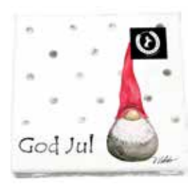
35102 Servetter Dekortomte vit 1 tomte 33x33cm Paper napkins Santa High hat white 1 santa 33x33cm Design Ruth Vetter