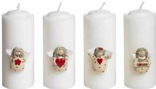
5375 Ljussticks Änglar 4 figurer H.4-5cm Candle decor Angels 4 figurer H.4-5cm Design Ruth Vetter