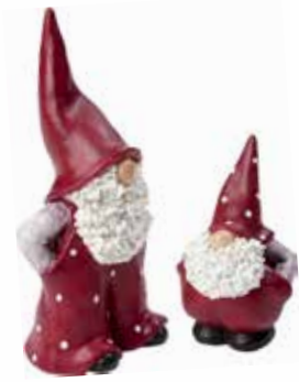
7250-S Tomtarna Elmer & Max H.5,5-9cm Santa Elmer & Max H.5,5-9cm