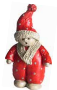
7603 Noa H.10,2cm Noa H.10,2cm