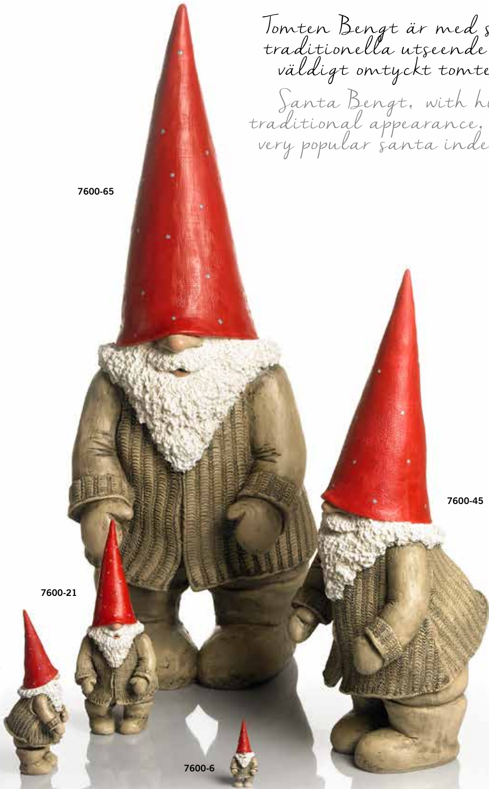
7600-6 Tomten Bengt H.6cm Santa Bengt H.6cm 7600-15 Tomten Bengt H.15cm Santa Bengt H.15cm 7600-21 Tomten Bengt H.21,5cm Santa Bengt H.21,5cm 7600-45 Tomten Bengt H.45cm Santa Bengt H.45cm 7600-65 Tomten Bengt H.65cm Santa Bengt H.65cm