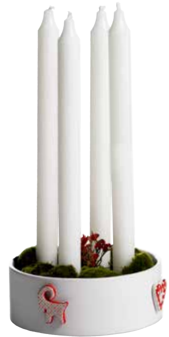
10507 Adventsjusstake Marie ø15cm Candle holder Marie ø15cm