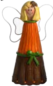
5350-2 Ängel Esmeralda orange H.10cm Ängel Esmeralda orange H.10cm Design Marie Stendahl