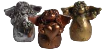
5378-3 Änglar metall 3st H.4cm Angels metal 3pcs H.4cm