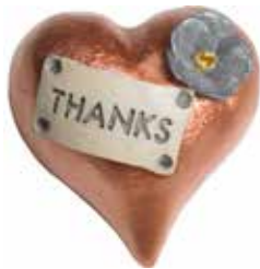
5639 Hjärta "Thank's" L.5cm Heart "Thank's" L.5cm