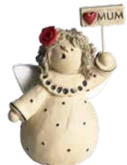
5370-6 Ängel "Love mum" H.7cm Angel "Love mum" H.7cm