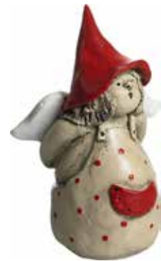
5360-12 Ängel December H.7cm Angel December H.7cm