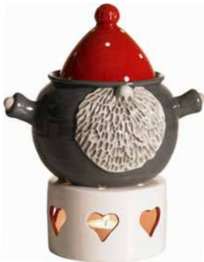
7785 Glöggkanna Tomten Hugo 75cl Glühwein pot Santa Hugo 75 cl