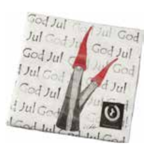
773880 Servetter Tomten den långa 33x33cm Paper napkins Tall Santa 33x33cm Design Ruth Vetter