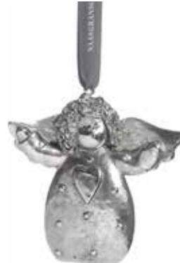
5371-3 Ängel dekoration silver H.7cm Angel decoration silver H.7cm