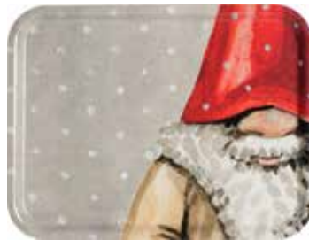
76004333 Bricka Tomten Bengt 43x33cm Tray Santa Bengt 43x33cm