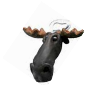
6940-2 Älg öppnare L.13cm Elk bottle opener L.13cm