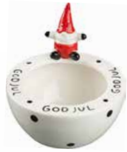
7215 Ljuslykta Tomten Tage ø8cm Candle holder Santa Tage ø8cm