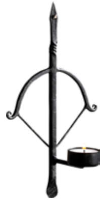
2362 Ljusstake vägg Armborst värmeljus H.26cm Candleholder Crossbow for wall wrought iron H.26cm