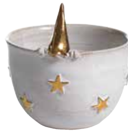
8990-7 Ljuslykta/Skål Tomte Guld ø7cm Candle holder/Bowl Santa Gold ø7cm