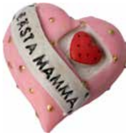
5620 Hjärta "Bästa mamma" L.5cm Heart "Bästa Mamma" L.5cm