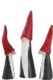
7730-31 Tomten den långa 3st H.7-9,5cm Tall Santa 3pcs H.7-9,5cm