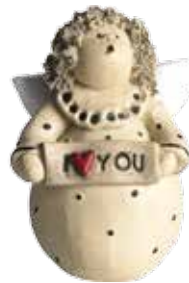
5370-3 Ängel "I love you" H.7cm Angel "I love you" H.7cm