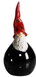
7521 Lykta Åke H.18cm Lantern Åke H.18cm