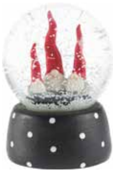
7050-W3 Snökula Dekortomte 3 tomtar H.11cm Snow ball Santa High Hat 3 santa H.11cm