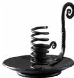
2373B Stumpastake svart ø14cm H.14cm Wrought iron stump candlestick black ø14cm H.14cm