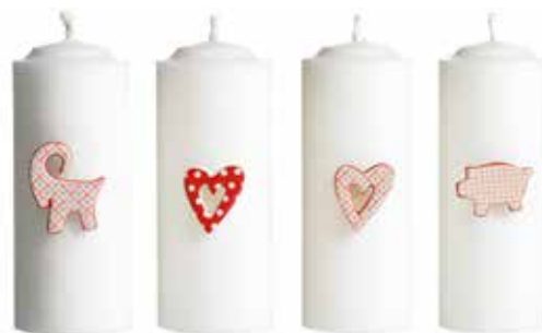
10506 Ljussticks Amore 4 figurer H.2-3,5cm Candle decor Amore 4 figures H.2-3,5cm