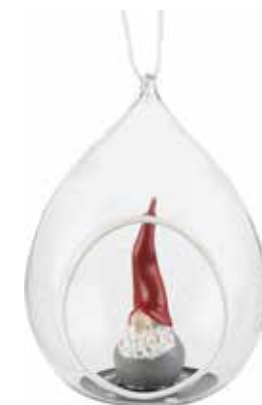
7051-G1 Glaskula Dekortomte 1 tomta H.10,5cm Glass ball Santa High Hat 1 santa H.10,5cm