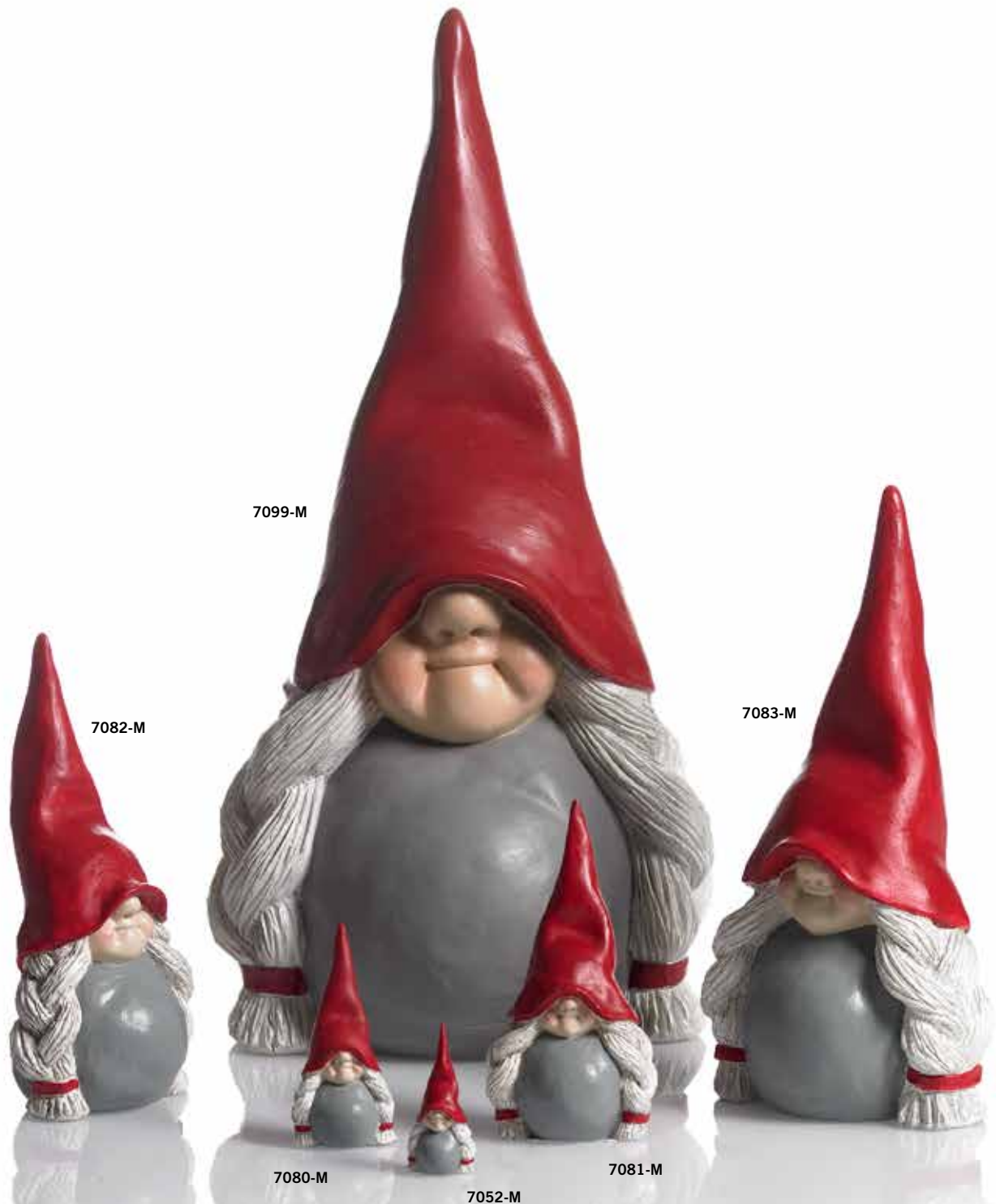
7052-M Dekortomte mor H.6,5cm Santa Mother High Hat H.6,5cm 7080-M Dekortomte mor H.10cm Santa Mother High Hat H.10cm 7081-M Dekortomte mor H.16cm Santa Mother High Hat H.16cm 7082-M Dekortomte mor H.22cm Santa Mother High Hat H.22cm 7083-M Dekortomte mor H.30cm Santa Mother High Hat H.30cm 7099-M Dekortomte mor H. 48cm Santa mother High Hat H.48cm