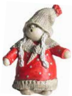
7602 Tova H.7,5cm Tova H.7,5cm