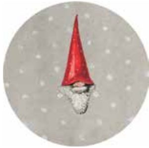
760021 Grytunderlägg Tomten Bengt ø21cm Pot stand Santa Bengt ø21cm