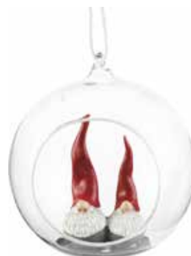
7051-G2 Glaskula Dekortomte 2 tomtar H.10,5cm Glass ball Santa High Hat 2 santa H.10,5cm