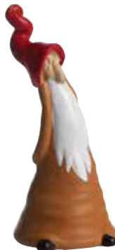
8930-2 Ljussläckare Svante rød H.11cm Snuffer Svante red H.11cm