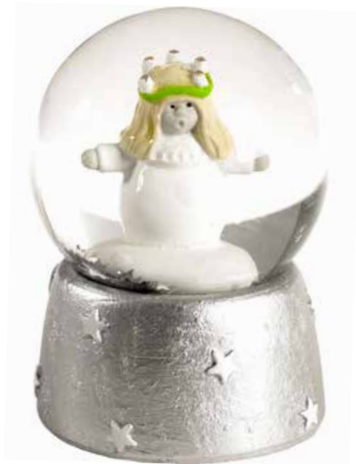
7127 Snökula Lucia H.6cm Snow ball Lucia H.6cm Design Ruth Vetter

Saint Lucia's Day or Luciadagen in Swedish, takes place on 13 December. In Sweden, more or less every town, school and home celebrates the feast of Saint Lucia. Lucia lights up our dark rooms early in the morning with her crown of light and she is followed by a retinue of maidens star boys and Christmas elves.