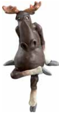
6921 Älg hängande ben liten H.16cm Elk hanging legs small H.16cm