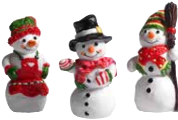
8561 Snögubbar 3st H.4cm Snowmen 3pcs H.4cm Design Marie Stendahl