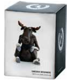
6917-2 Älg sittande i presentask H.8cm Elk sitting in Gift box H.8cm