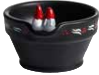
8855-7 Skål Thor & Thora ø7cm Bowl Thor & Thora ø7cm