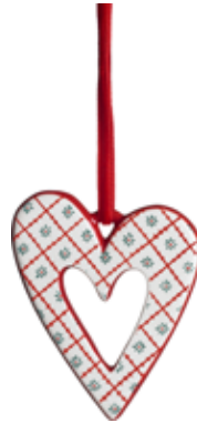
10501 Lilla hjärtat 4st H.7cm Little heart 4pcs H.7cm