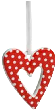
10505 Dekoration Valentin 4st H.7cm Decoration Valentin 4pcs H.7cm