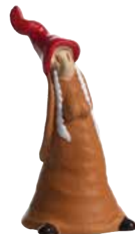
8930-3 Ljussläckare Lisa rød H.9,2cm Snuffer Lisa red H.9,2cm