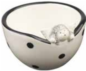
5311 Skål Tittut Ängeln ø11cm Bowl Peek-a-boo Angel ø11cm