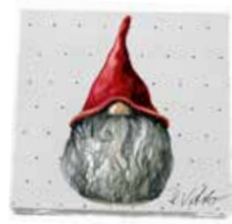
34108 Servetter Tomten Herman 25x25cm Papernapkins Santa Herman 25x25cm