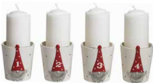
7784 Glöggmugg/ljusstake Tomten Hugo 4st H.7,5cm Cup/candle holder Santa Hugo 4pcs H.7,5cm