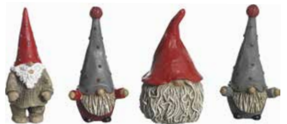
6002 Familjen Johansson 4 figurer H.6cm Family Johansson 4 figures H.6cm